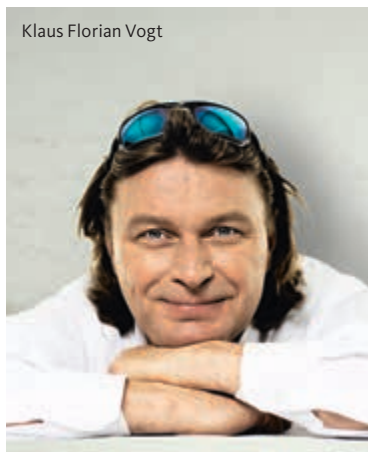
Klaus Florian Vogt

In Mahlers »Lied von der Erde« verschmelzen Lied und Sinfonie zu einem bewegendem Weltabschiedswerk, dem die schottische Mezzosopranistin Karen Cargill und der gefeierte Wagner-Tenor Klaus Florian Vogt solistischen Glanz verleihen. Benjamin Britten's Violinkonzert, 1939 unter dem Eindruck des Kriegsausbruchs komponiert, liegt bei dem deutsch-amerikanischen Geiger Augustin Hadelich in besten Händen.